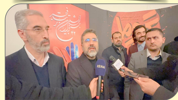
وزیر فرهنگ و ارشاد اسلامی در تالار وحدت به تماشای نمایش «تروما» نشست و از حمایت نمایش‌های استانی خبر داد.