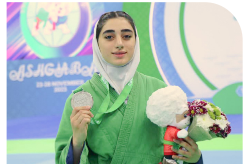
پردیس عید یونانی: