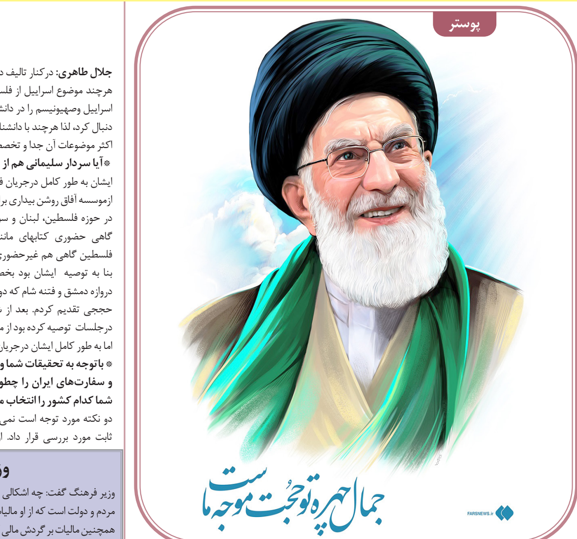
جمال‌تیره توجبت موجبتا

وزیر فرهنگ گفت: چه اشکالی دارد هنرمندی که کارش پر رونق است، مالیات بدهد؟ این حق مردم و دولت است که از او مالیات بگیرند. «محمد مهدی اسماعیلی» درباره مالیات هنرمندان و همچنین مالیات بر گردش مالی کنسرت‌های موسیقی اظهار کرد: ما موافق عدالت مالیاتی هستیم