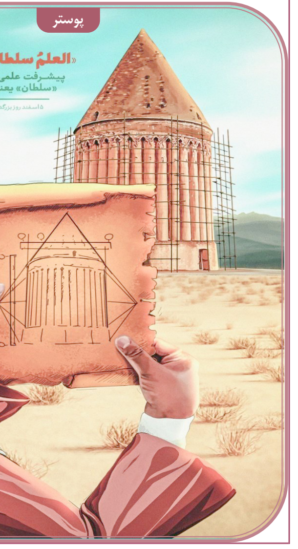
پوستر «العلم سلطان» پیشرفت علمی، کشور را قدرتمند می کند. «سلطان» یعنی اقتدار، علم، اقتدار است. زهره معتمدی ۱۵ اسفند روز بزرگ است خواجه نصیرالدین طوسی روز مهندس

مدیرعامل خانه کتاب و ادبیات ایران با اشاره به اقدامات انجام شده در سال های اخیر برای افزایش ظرفیت های حضور و نقش آفرینی صنعت نشر ایران در دیگر کشورها، ادامه داد: یکی از این اقدامات بستر سازی برای فعالیت در نمایشگاه بین المللی تهران است. قائم مقام سی و پنجمین نمایشگاه بین المللی کتاب تهران با اشاره به مذاکراتی که در نمایشگاه دهلی نو با مسئولان نمایشگاه فرانکفورت، ریاض، شارجه و ابوظبی دستاوردهای حضور ایران در سی و دومین نمایشگاه بین المللی کتاب دهلی نو گفت: خط مستمر مذاکره با کشورها و ناشران مختلف برای برقراری همکاری در نمایشگاه های بین المللی دنبال می شود. همچنین از ناشران و مسئولان کشورهای مختلف دعوت می شود تا در نمایشگاه تهران حضور پیدا کنند. در سال های اخیر برای افزایش ظرفیت های حضور و نقش آفرینی صنعت نشر