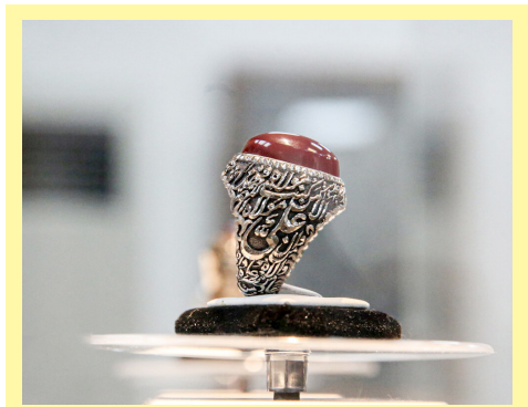
جشنواره هنرهای سنتی و صنایع دستی از افطار تا سحر بر گزار می‌شود