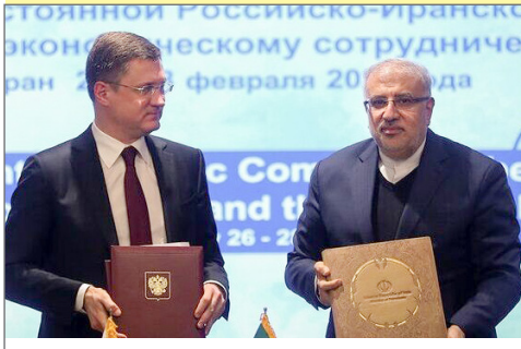
الکساندر نواک: مذاکره با ایران برای سوآپ نفت و گاز ادامه دارد