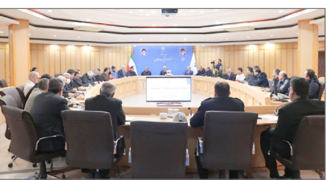
جلسه مدیریت بحران ناترازی گاز برگزار شد