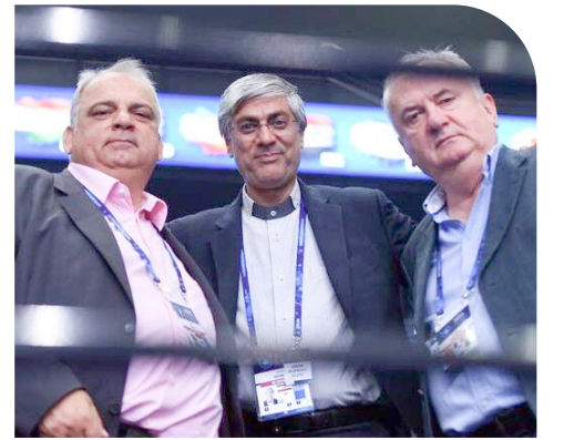
رایزنی‌های با نهاد لالوویج رئیس اتحادیه جهانی: بازگشت شاهین ایرانی با دیپلماسی ورزشی