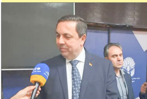
سفیر سوریه: مشارکت در بازسازی سوریه فرصت طلایی برای ایرانی‌هاست